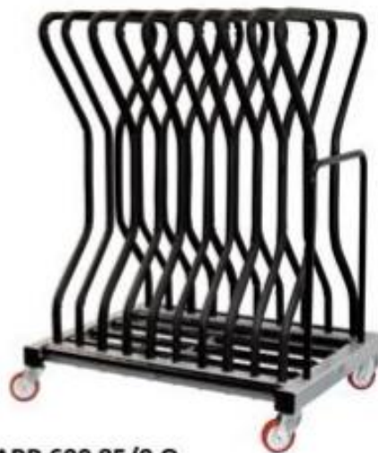
CARR 600 85/9 Q