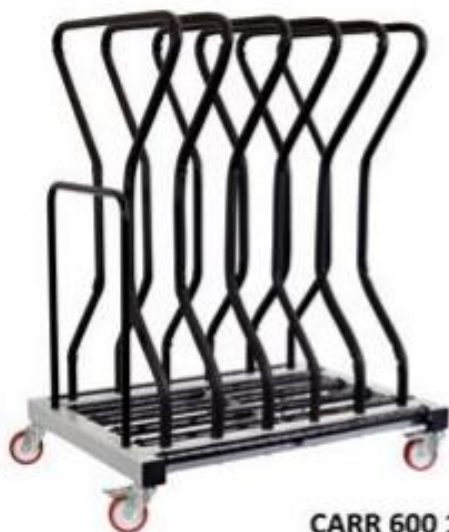
CARR 600 164/5 Q

Καρότσι για μεταφορά και αποθήκευση κασών-φύλλων