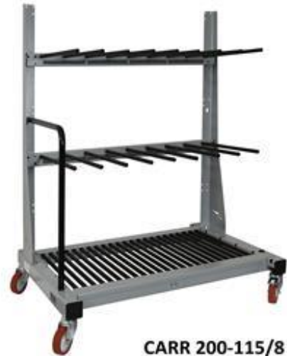
CARR 200-115/8 Q