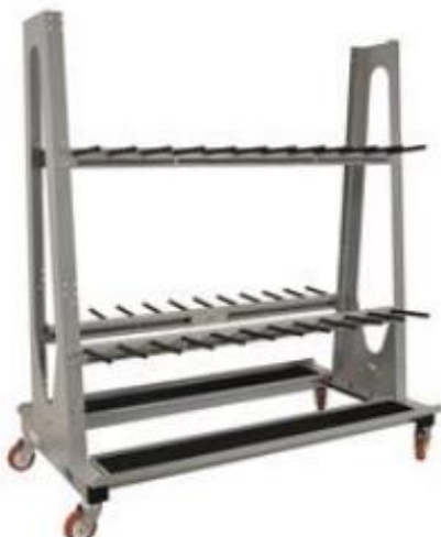
CARR 230-120/22 Q