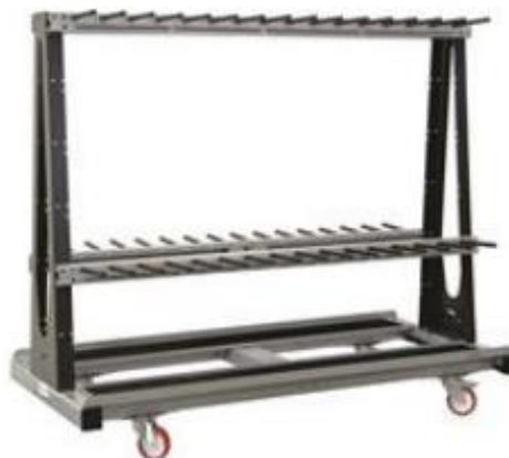
CARR 230-100/30 Q