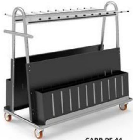
CARR PF 44