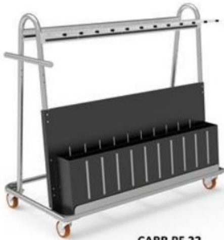
CARR PF 22